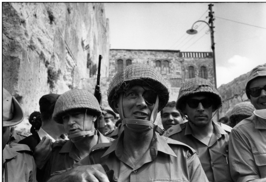
Moshe Dayan arrivant au Mur des lamentations après la conquête de Jérusalem-est durant la guerre des six jours